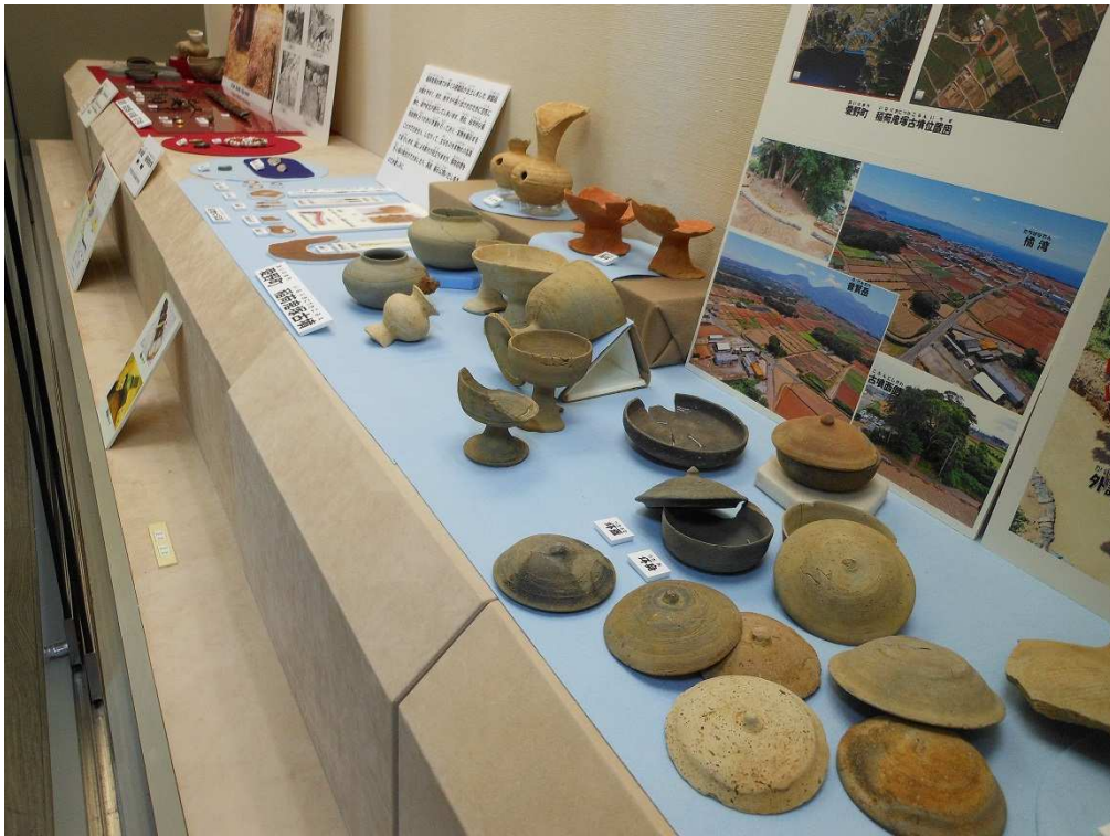
愛野町稲荷鬼塚古墳 古墳時代 祭祀用須恵器（6世紀～7世紀）