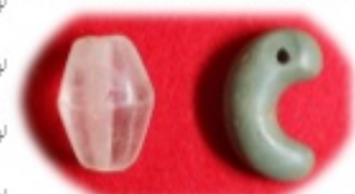
雲野町 稲荷鬼塚古墳出土品

雲仙市教育委員会では、各種開発事業に伴い、遺跡の発掘調査を行っています。今年6月から8月に調査した「稲荷鬼塚古墳」の出土品と、市指定文化財「高下古墳」の出土品を展示します。出土品をとおして、雲仙市の歴史について感じてみませんか。