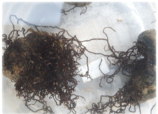
水槽の中のオキチモズク（※展示品は標本です）