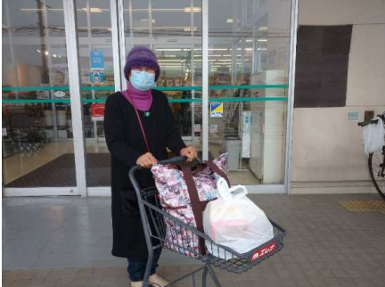
買物にご利用されたお客様

買物に使えて大変便利です。もっとたくさんのお店にスポンサーになっていただきたいです。